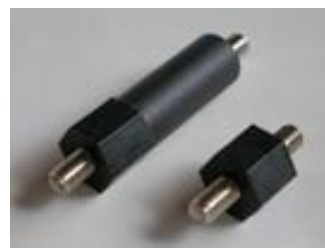
PSM3C (M3 P-0.5)

材質 = PPS 樹脂 (UL94V-0) 色 = 黒 使用温度 = -40~220℃ 金属ネジ = 黄銅 (ニッケルメッキ) 外周アヤメローレット